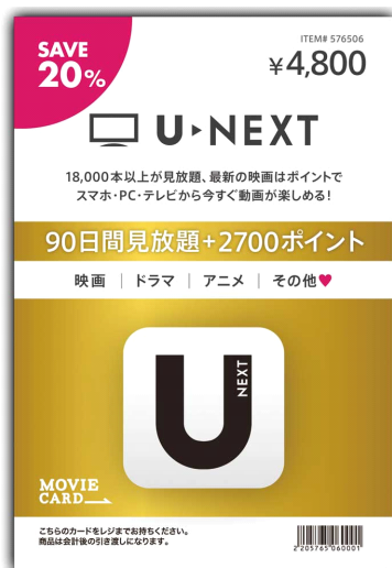
【ディスプレイカード】